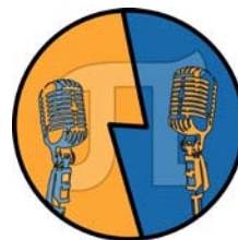
Искусство управленческой борьбы