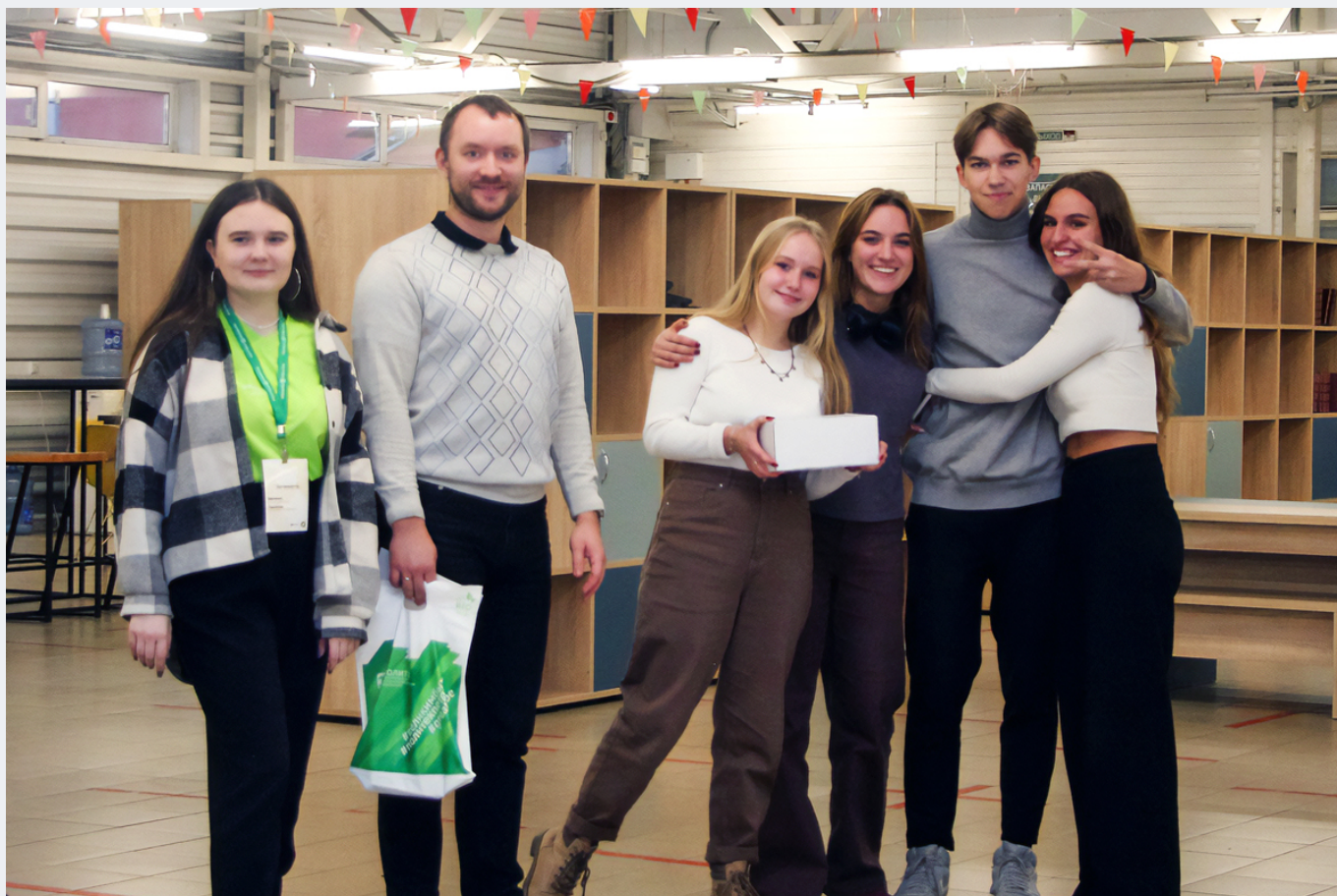
Участниками интенсива стали школьники из разных городов России: Стерлитамака, Тюмени, Челябинска, Санкт-Петербурга и др.