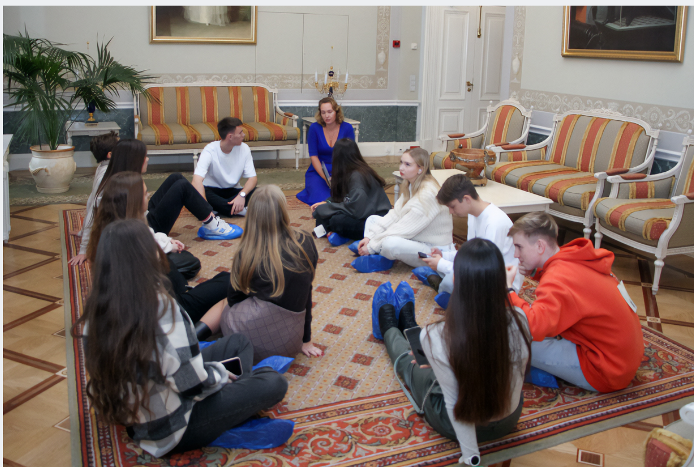
В рамках интенсива ребята узнали об особенностях организации туристской деятельности в России и Санкт-Петербурге, научились составлять и оформлять городские туристские экскурсионные маршруты и учитывать маркетинговую и экономическую составляющую при запуске туристского стартапа. В качестве экскурсионной составляющей, поддерживающей туристскую