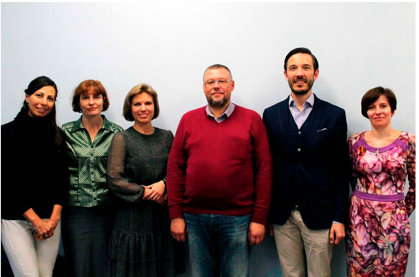
Лектор задавал вопросы, инициировал дискуссии по теме, что способствовало установлению