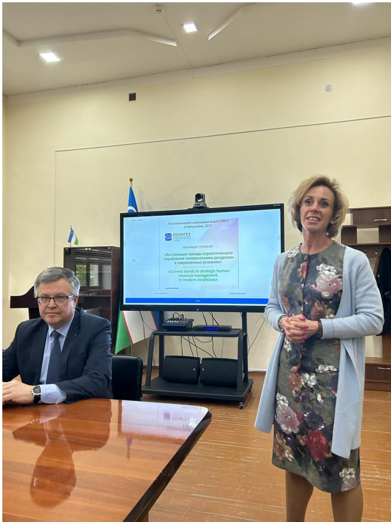
В Ташкентском государственном техническом университете состоялась торжественная церемония подписания соглашения о стратегическом партнерстве. Помимо этого, ректоры